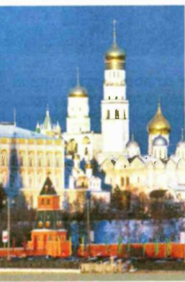
לצד צניחת מחיר הנפט, התרסקות שוק המניות ושחיקת המטבע, הבעיה המרכזית שמעיבה על איתנותה של הכלכלה הרוסית היא שחיקת המעמד הבינוני

גם העובדה ששוק המניות הרוסי חווה את הפגיעה החדה ביותר מ-20 שוקי ההון הגדולים בעולם, לא מותירה הרבה מקום לאופטימיות בקרמלין. למרות אלה, נראה שהבעיה המרכזית שמעיבה על איתנותה של הכלכלה הרוסית היא שחיקת המעמד הבינוני. מוסקבה וסנט פטרבורג – שתי הערים שמושכות הכי הרבה השקעות זרות – הן שתי הערים