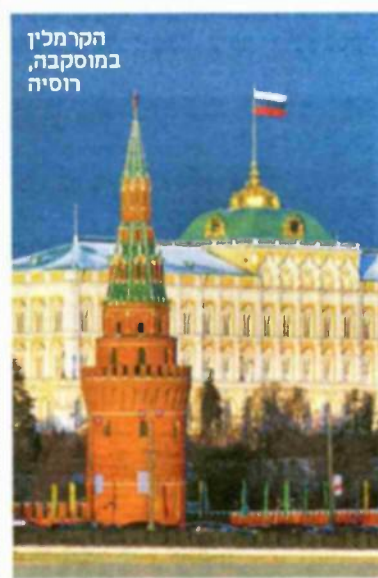
לצד צניחת מחיר הנפט, התרסקות שוק המניות ושחיקת המטבע, הבעיה המרכזית שמעיבה על איתנותה של הכלכלה הרוסית היא שחיקת המעמד הבינוני

הכמעט יחידות הנהנות ממנעמי המ-ערב, הן מבחינה פוליטית והן מבחינה כלכלית ותדבובתית. עם זאת, גם שם ישנה חשיפה למשכר. כך, למשל, מחירי הנרל"ן במוסקבה ידרו בכ-30% במוצק, ובסנט פטרבורג בכ-40%. המצב חמור יותר בעדים אחרות, שם ירידת המחירים מגיעה לכ-60%, עובדה הנובעת מכך שהמעמד הבינוני